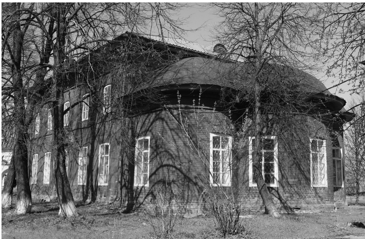
Рис. 1. Преображенский собор Тобольского Знаменского монастыря, построенный по проекту Б. Цинке в 1900—1905 гг. (современное состояние).