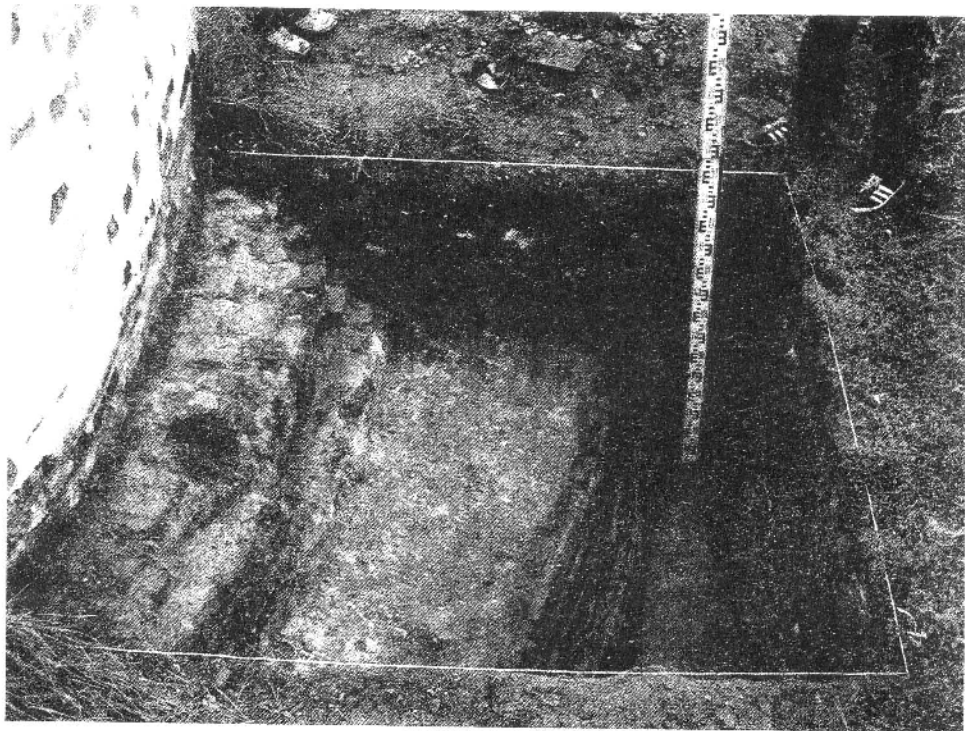
Рис. 1. Шурф 2. Фундамент круглой башни