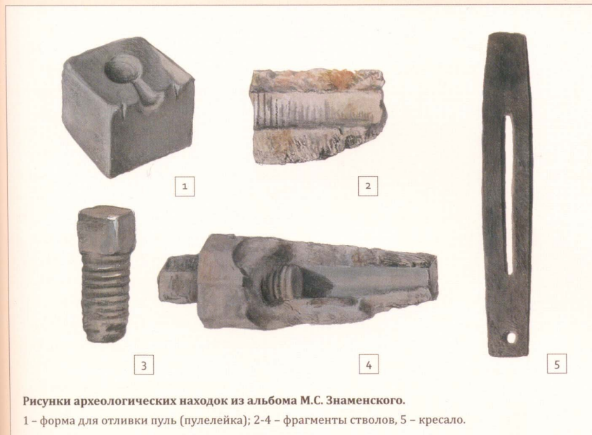
Рисунки археологических находок из альбома М.С. Знаменского. 1 – форма для отливки пуль (пулелейка); 2-4 – фрагменты стволов, 5 – кресало.

конца XVI-XVII вв. (по материалам фондов ТИАМЗ)