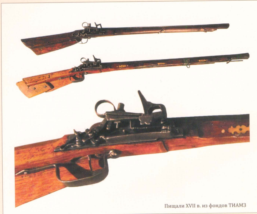
Пищали XVII в. из фондов ТИАМЭ