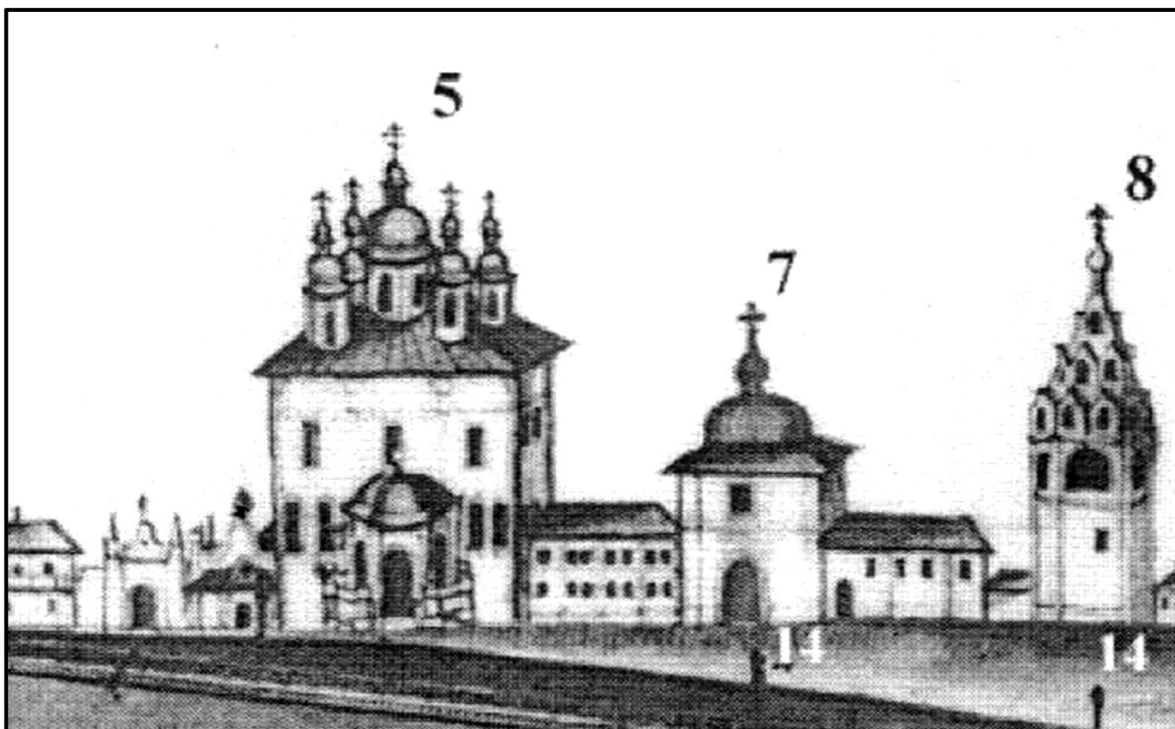
Рис. 2. Западные Святые ворота (7) на плане Я. Укусникова 1751 г. (по: [11, с. 177])