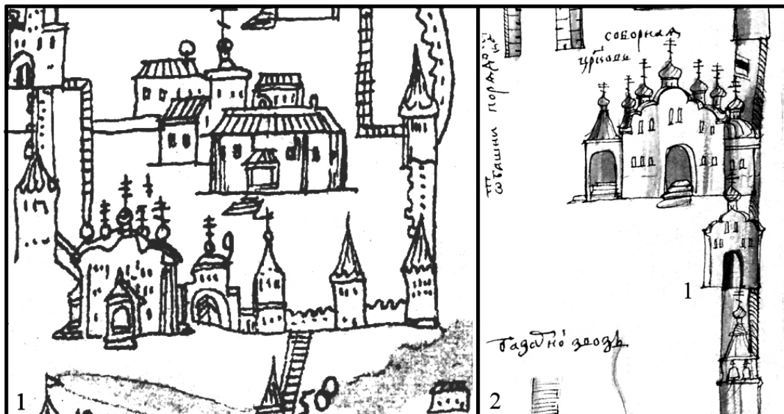
Рис. 1. Западные Святые ворота на планах С.У. Ремезова начала XVIII в.: 1 (9) — по: [12, л. 4]; 2 (1) — по: [13, л. 135 об.— 36]

14. Remezov, Semen Ul'ianovich, 1642-ca. 1720. Khorograficheskaya kniga [cartographical sketch-book of Siberia]. MS Russ 72 (6). Houghton Library, Harvard University, Cambridge, Mass. [229 pages]. — URL: http://pds.lib.harvard.edu/pds/view/18273155 (дата обращения: 07.05.2015).