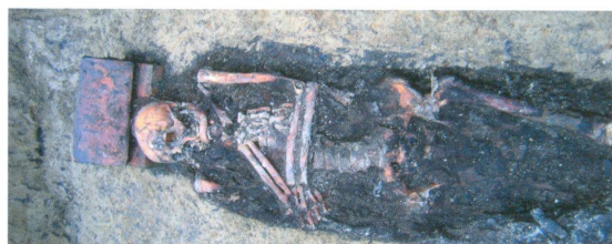
Погребение монаха с кирпичами в изголовье.

Отдельно хочется отметить, что внутри Софийско-Успенского собора и его Северного придела осуществлялись погребения и в более позднее время. Однако если в XVII веке возле деревянного храма хоронили простых прихожан, то с начала XVIII века на территории рядом с собором и внутри него погребали представителей высшей церковной иерархии Тобольска. Всего при археологических исследованиях расчищены семь каменных склепов XVIII – начала XX вв.