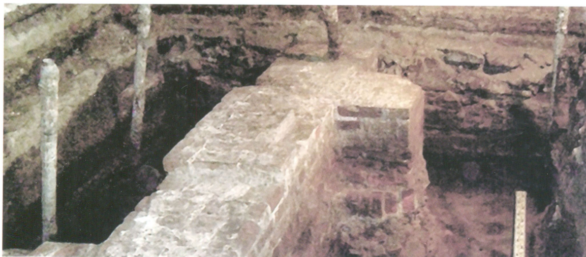
Каменная ограда Софийского двора конца XVII века

Археологические исследования, проведенные в Софийско-Успенском соборе Тобольска, свидетельствуют о том, что в Тобольском кремле имеются уникальные по своей сохранности и научной значимости культурные слои, содержащие свидетельства материальной и духовной культуры ранних этапов истории города Тобольска.