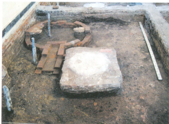
Фундаменты крестильной купальни и опора чугунного пола XIX века

можно датировать в рамках 1640-1680-х годов. На территории Тобольского кремля выявлено несколько христианских кладбищ, действовавших не позднее первой половины XVIII века. На сегодняшний день такие находки являются единственными указателями, позволяющими определить месторасположение древних деревянных церквей города.