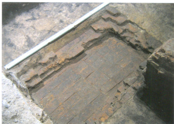
Остатки склепа митрополита Иоанна Максимовича