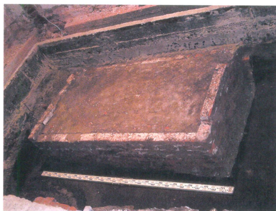
Склеп епископа Гермогена

В Северном приделе во время раскопок были обнаружены остатки склепа, в котором был захоронен митрополит Тобольский Иоанн Максимович, причисленный к лику святых в 1916 году. Здесь же было обнаружено место погребения священномученика Гермогена, епископа Тобольского и Сибирского в 1917-1918 гг. В июне 1918 года епископ Гермоген был утоплен. Позднее он был похоронен в Северном приделе Софийского собора. Долгое время сведения о месте захоронения отсутствовали. И лишь в результате реставрационных и археологических исследований удалось определить точное местоположение гробницы. В сентябре 2005 года состоялось обретение мощей святого.