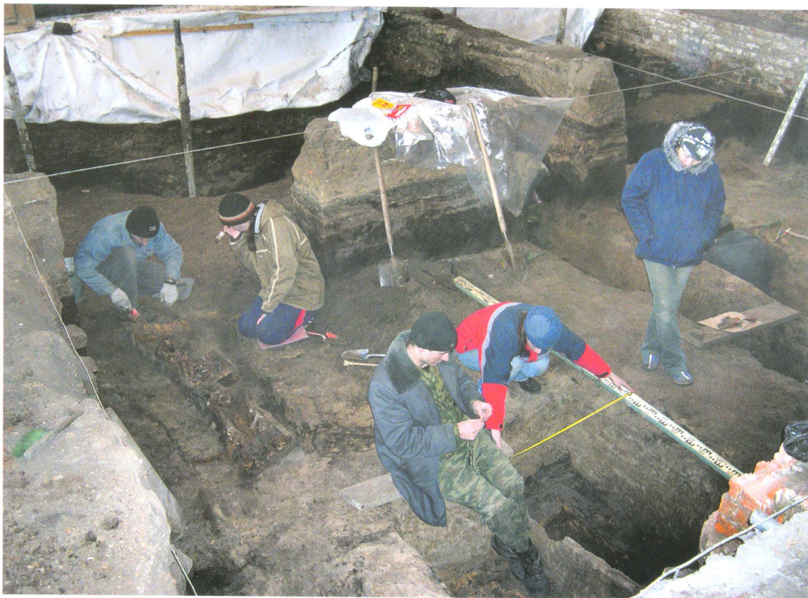
Расчистка погребений внутри Софийского собора

зовано согласно традициям тех времен на землях, прилегающих к деревянному храму 1646-1648 годов постройки, который прекратил свое существование, как считается, в большом городском пожаре 1677 года. Позднее, при возведении каменного собора, часть погребений оказалась в его пределах. Таким образом, обнаруженное кладбище