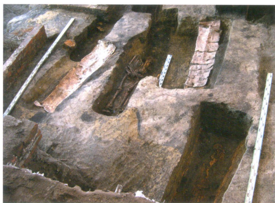
Погребения Софийского кладбища XVII века

Сопутствующий инвентарь беден или отсутствует вовсе. Так, например, в погребениях софийского кладбища не найдено ни одного нательного креста. Необходимо отметить, что в Европейской России традиция хоронить с крестами появляется только