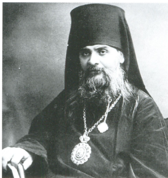
Гермоген, епископ Тобольский и Сибирский в 1917-1918 годах

Достаточно часто в области ступней встречаются остатки кожаной обуви. В XVII в. это так называемые калигвы – погребальные тапочки, изготовленные из одного куска кожи. Формировались они при помощи двух швов (в области носка и пятки). Соединение краев производилось несколько небрежно, косым обметочным швом. Простота изготовления и отсутствие следов снашивания на тапочках позволяют утверждать, что изготавливались они специально для покойного и не использовались в повседневной жизни. Достаточно редкой особенностью является использование в погребальном обряде разного рода подушек. В одном погребении зафиксирован веник (возможно, березовый), положенный под голову усопшему.