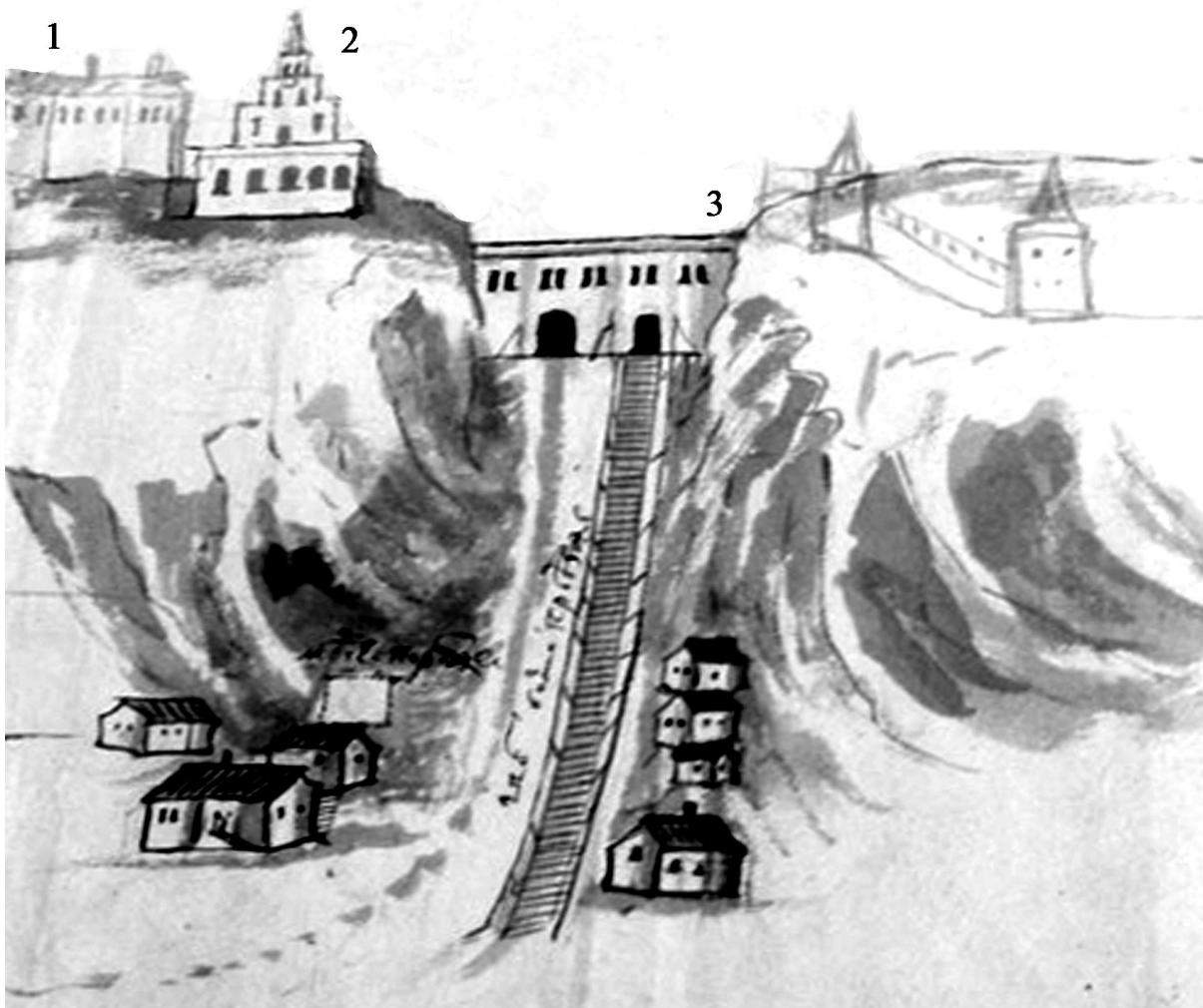
Рис. 2. Чертеж-рисунок города Тобольска с обозначением Большого Своза («Звоза») между Кремлем и посадом, построенного пленными шведами. 1714 г. Тушь. 1 — Приказная палата; 2 — Вознесенская церковь; 3 — Дмитриевские ворота (по: РГАДА. Ф. 214. Оп. 5. Д. 2313. Л. 473)