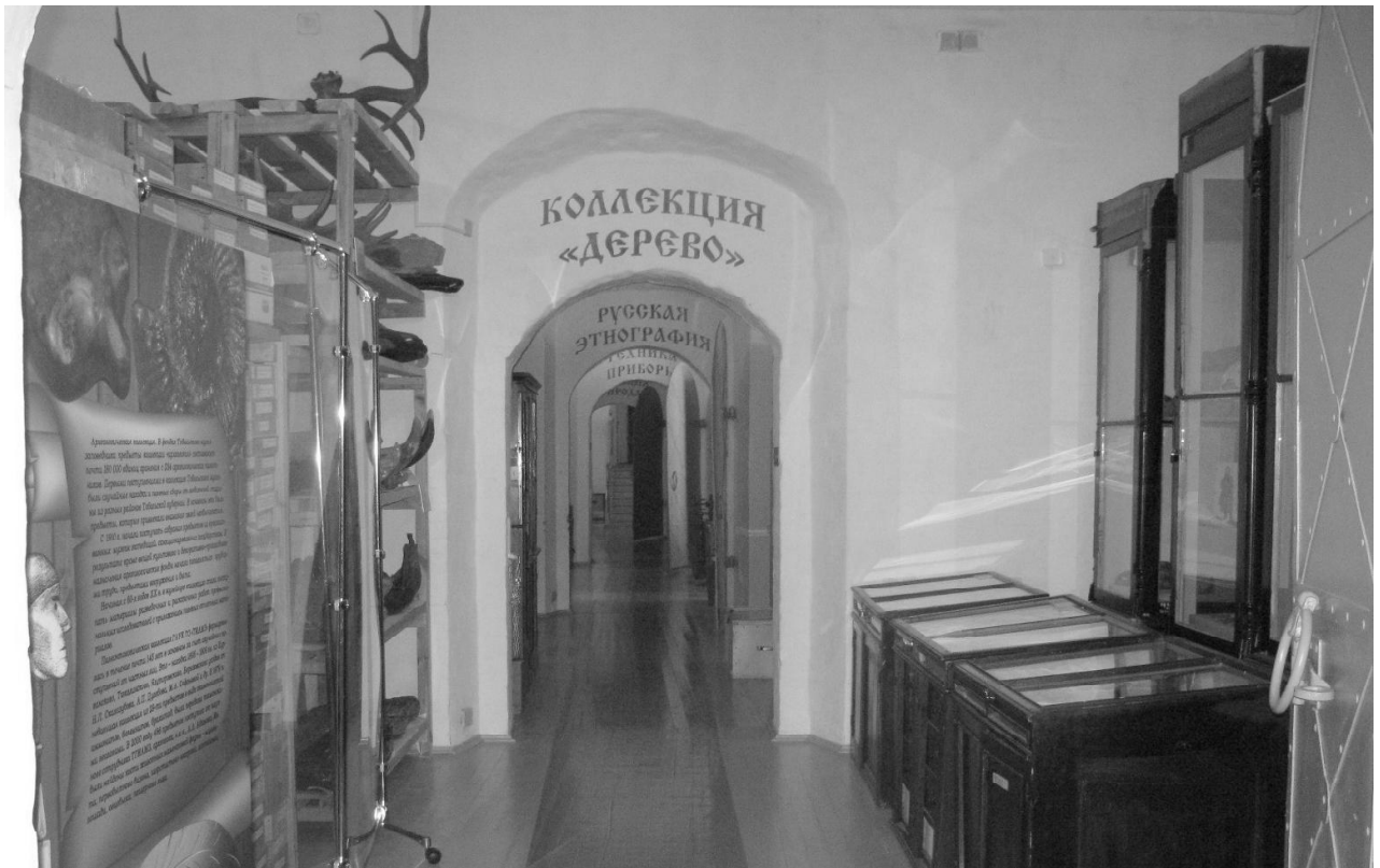
Рис 3. Рентерея. Открытое фондхранение. 2015 г.