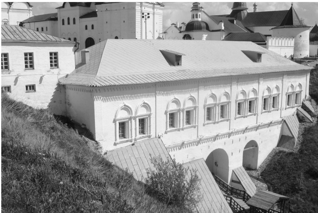
Рис. 1. Здание Рентереи. Современный вид. Южная сторона. Снимок автора