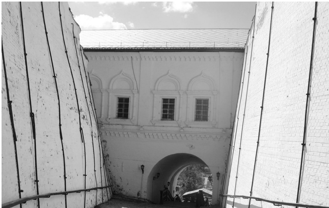
Рис 5. Здание Рентереи. Современный вид. Северная сторона.