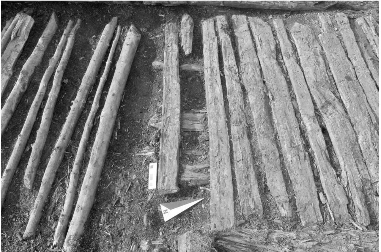
Рис. 5. Постройка №7. Участок настила вдоль западной стены; наблюдается разная степень плотности укладки древесины настила.