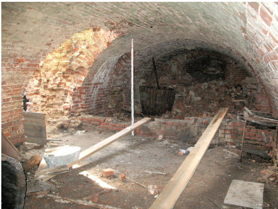
Рис. 3. Иоанно–Введенский монастырь. Окрестности г. Тобольска, Тюменская обл. Подвал Троицкого собора. Вид с востока.