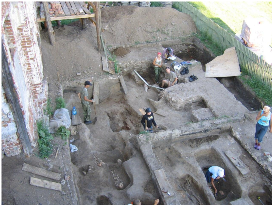
Рис. 4. Абалакский монастырь. С. Абалак, Тобольский р–н, Тюменская обл. Рабочий момент раскопок южного придела Никольской церкви. 2008 г.