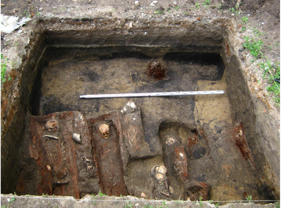
Рис. 5. Абалакский монастырь. С. Абалак, Тобольский р-н, Тюмен- ская обл. Раскопки погребений с южной стороны церкви преподобной Марии Египетской.