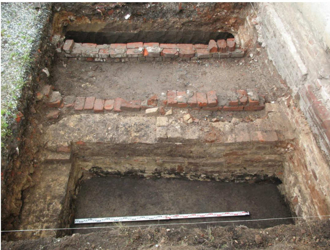
Рис. 1. Иоанно–Введенский монастырь. Окрестности г. Тобольска, Тюменская обл. Вид с запада на фундамент придела храма Иоанна Предтечи.