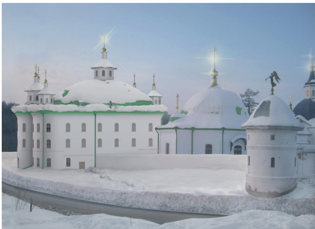
Рис. 2. Троицкий собор в современном окружении Иоанно–Введенского монастыря. Реконструкция автора