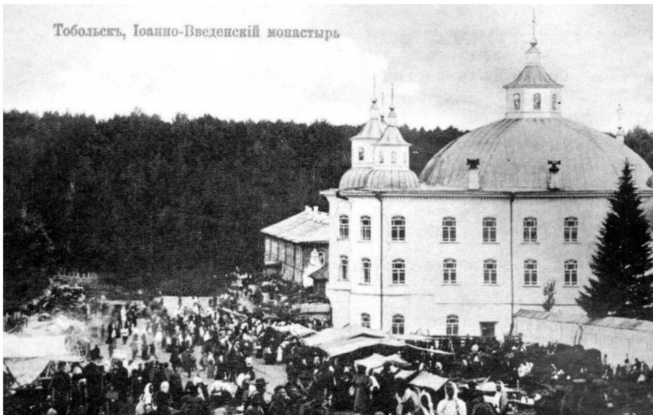
Рис. 2. Троицкий собор Иоанно-Введенского женского монастыря. Начало XX в.