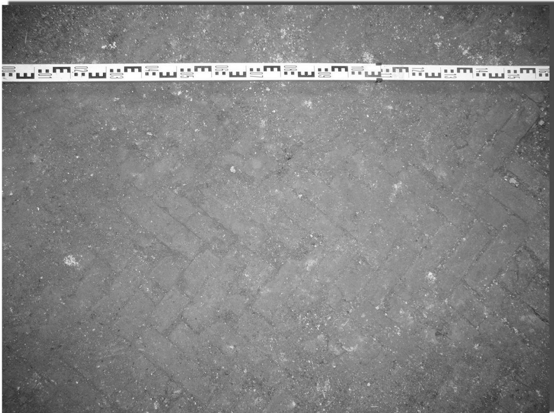
Рис. 4. Подвальное помещение Троицкого собора. Сверху — вид с востока, снизу — пол подвала