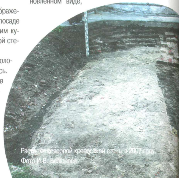
Раскопки северной крепостной стены в 2007 году.

Несомненно, Гостиный двор долго ждал реставрации. В 1980-е годы XX века часть работ по восстановлению его облика была проведена, но не до конца. И вот, в 2009 году начался новый этап по подготовке проектной документации, а уже 19 июля 2014 года состоялось официальное открытие. Гостиный двор предстал перед нами не только в обновленном виде,